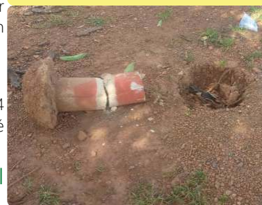
Conflit sur le bornage - 17/10/22