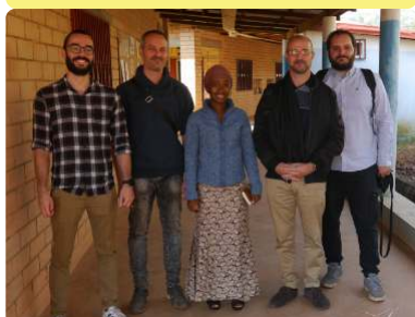
Visite des locaux de Guinée Solidarité avec le siège du Partenariat - 11/11/22

L'atelier a regroupé les 16 OSC impliquées ainsi que les structures d'accompagnement. Il s'agissait de mener ensemble une réflexion sur les réussites et échecs du programme.