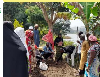
Formation des maraichers à Touri - 29/10/22