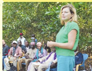
Intervention de l'Ambassadrice de l'Union européenne - 07/12/22