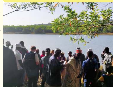
Visite du site du sous-bassin de Touri 07/12/22