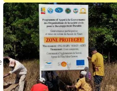
Installation d'une plaque d'information à Touri - 07/12/22