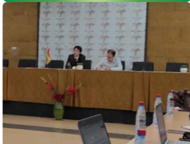
Atelier de capitalisation du PISCCA à Conakry - 03/11/22