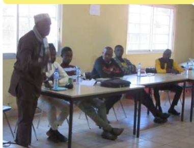
Etude diagnostic à Labé - 30/12/22

La troisième est en cours de réalisation au niveau national sous la supervision du Ministère de l'Enseignement technique et de la Formation professionnelle et de l'Agence du Service Civique d'Action pour le Développement, en dehors du programme Agis! .