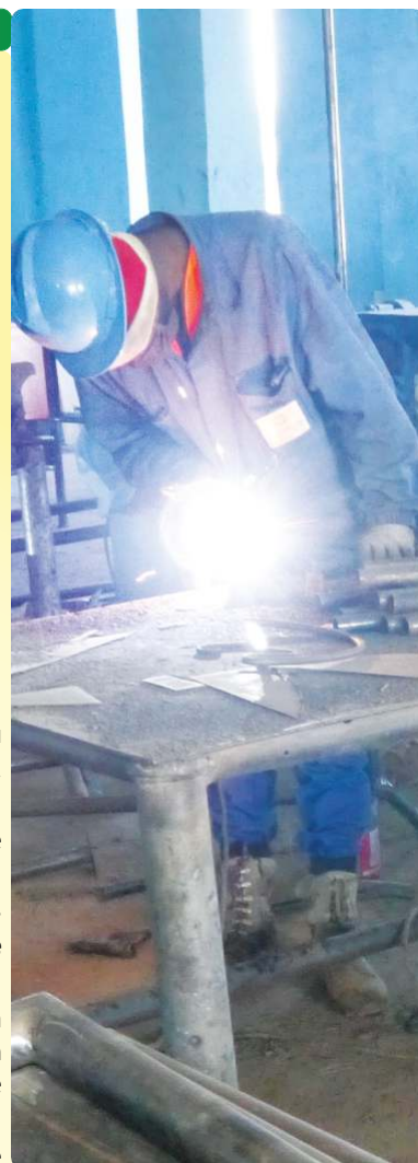
Visite des ateliers de FAPEL avec le siège du Partenariat - 10/11/22

L'exemple de Touri illustre parfaitement la démarche mise en œuvre dans le PAGODD : renforcement de capacités des acteurs, mobilisation et concertation entre la société civile, les autorités locales et services de l'Etat. Enfin, cela montre aussi la prise de conscience des enjeux environnementaux sur le quotidien des habitants de Labé.