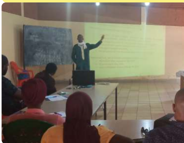
Mise en place du Comité de Suivi Opérationnel - 30/09/2020