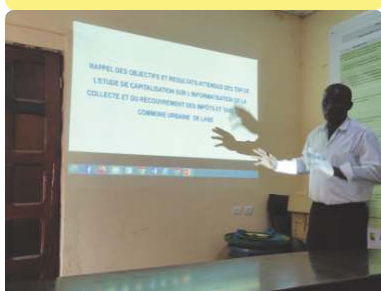
Réunion de cadrage pour la capitalisation - 13/12/22

Dans le cadre du PISCCA, le Partenariat et son partenaire FMG ont assuré le suivi de fin de projet des consortiums VBG, du 24 au 29/10 à Labé et le 29/11 à Conakry.