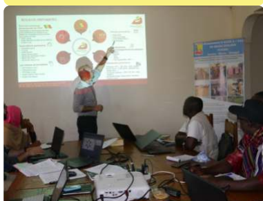
Réunion de l'UGP Agis - 10/11/22