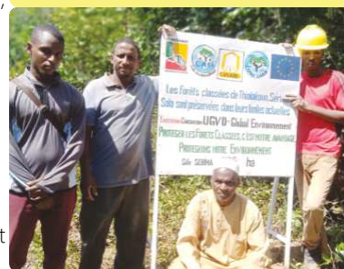
Plaque informative de délimitation des forêts - 09/11/22