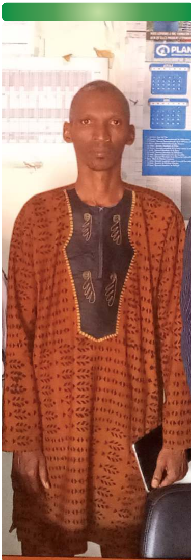
Echange de pratiques à Mamou 23/06/22