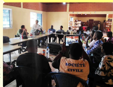
Mobilisation des acteurs pour l'appui au CODEC - 11/06/24