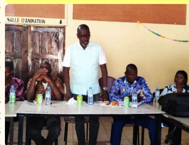
Prise de parole du Président de l'UCG 11/06/24