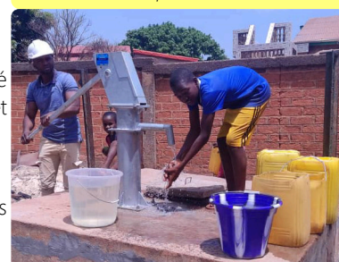
Réception provisoire du point d'eau du collège Maleya - 05/06/24

La réhabilitation de 9 points d'eau dans la commune de Labé est achevée. Elle concerne des points d'eau dans les quartiers, dans un marché et dans des établissements scolaires.