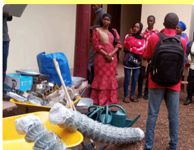
Remise des kits aux groupements agricoles - 08/06/24