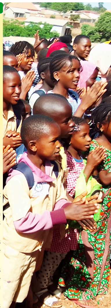
Sensibilisation sur le lavage des mains à l'école de Bournete - 05/06/24

A Pita et Mamou, il n'existait pas de structure au préalable mais des alerteurs. Avec l'appui de nos ONG partenaires (ADID et AFVDD) et des communes, des représentants étatiques, communaux et de la société civile ont été réunis pour cette première rencontre avec l'UCG afin de comprendre les enjeux d'une association de consommateurs et recevoir des conseils pour faciliter la mise en place et le fonctionnement d'une telle structure. Durant le prochain trimestre, il est prévu que les associations soient formalisées et opérationnelles.