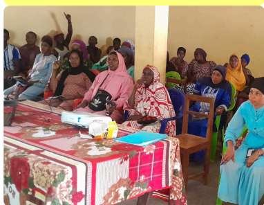
Formation entrepreneuriat à Popodara - 30/04/24