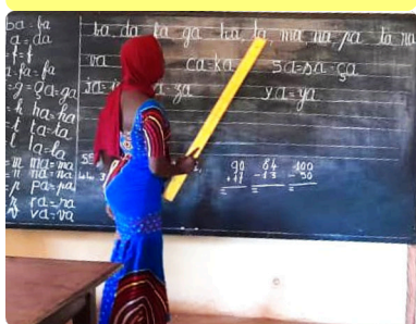
Poursuite de l'alphabétisation avec ADID - 24/04/24