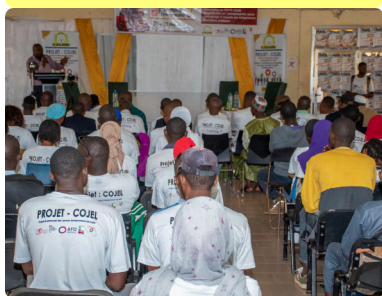
Salon de l'entrepreneuriat à Labé - 23/05/24