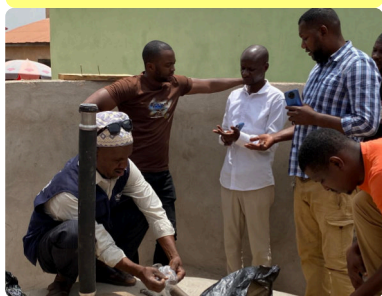
Suivi de la réhabilitation d'un point d'eau avec le SNAPE - 06/05/24