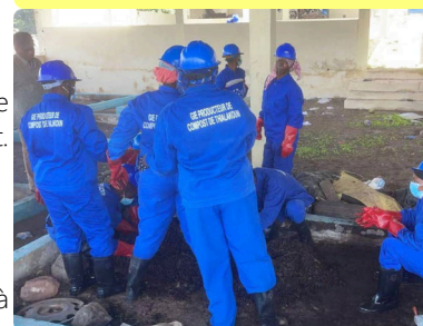
Equipe de producteurs de compost - 24/06/24

Cette réunion de travail avec ADID, la commune, le Sicoval, les services des Impôts et de l'Habitat a permis d'établir le rôle de chacun des services dans la préparation du recensement.