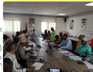
Réunion préparatoire au Gouvernorat - 05/04/24

Tous les services préfectoraux et régionaux impliqués dans le recouvrement de taxes et impôts étaient réunis en vue de la mise en place du cadre de concertation communal sur les finances de Labé.