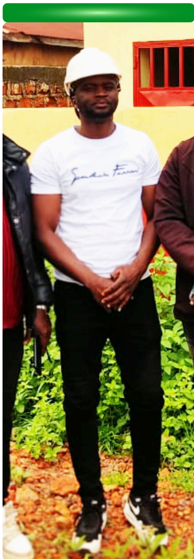
L'ingénieur conseil lors d'une réception définitive - 31/07/24