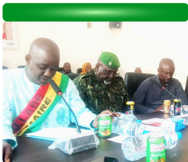
Discours lors de l'atelier de lancement du PROACT - 25/06/24